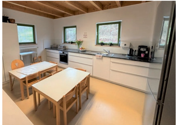
In der neuen Küche ist genug Platz, um mit den Kindern zu backen oder zu kochen.